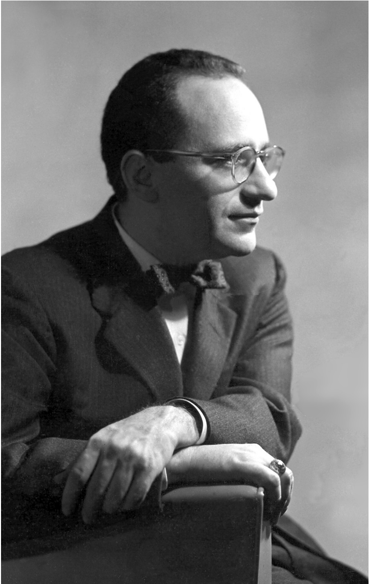
Murray Newton Rothbard